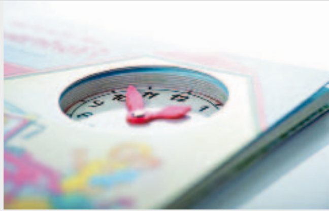
„Fassbare“ Uhrzeit: Innenstanzung mit eingepasstem Uhrelement

sen lassen aber immer mehr Verlage, aufgrund von Problemen mit der Kommunikation und bei der Realisierung der Aufträge, anstatt in Asien heute lieber in Deutschland produzieren.“