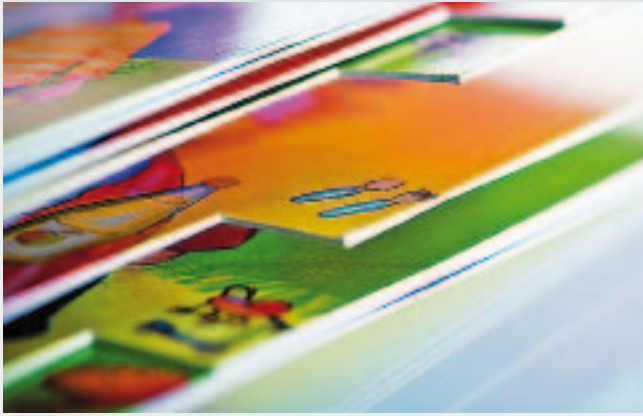
Alles auf einen Blick: Möglichkeit eines farbigen Treppenregisters.