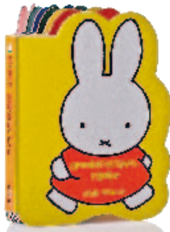
Handlich-rundlich: Pappebuch für die jüngsten Welt-„Entdecker“

Während einzelne Kunden zunehmend crossmedial aufgewertete Printprodukte wünschen, bevorzugen andere handliche Pappebücher mit wattierte Buchdecke und abgerundeten Ecken. Sachsdruck hat sich mit der Investition in eine neue Buchdeckenmaschine auf diese Anforderungen eingestellt (siehe Infokasten). Pappebücher werden bereits seit 2003 auf einer eigens für die Firma von einem Sondermaschinen- und einem Stanzautomatenhersteller konstruierten Spezialbuchstrecke produziert. Innerhalb eines Durchgangs werden Titel mit max. 14 Inhaltsseiten gefertigt. Ungefähr 4500 Bücher/Std. in Formaten von 10 x 22 cm bis 27 x 56 cm sind somit möglich. Nachdem mehrere Kunden Aufträge in größeren Formaten und geringsten Stückzahlen erteilen, will die Firma demnächst voraussichtlich eine neue Spezialanlage für Kleinauflagen erwerben.